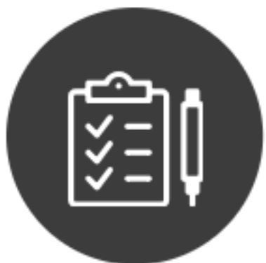
1차 - 서류접수