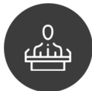
2차 - 면접