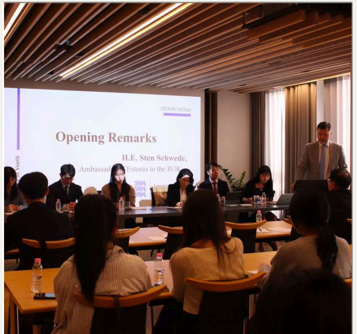
주한에스토니아대사관 주제: 정보의 자유