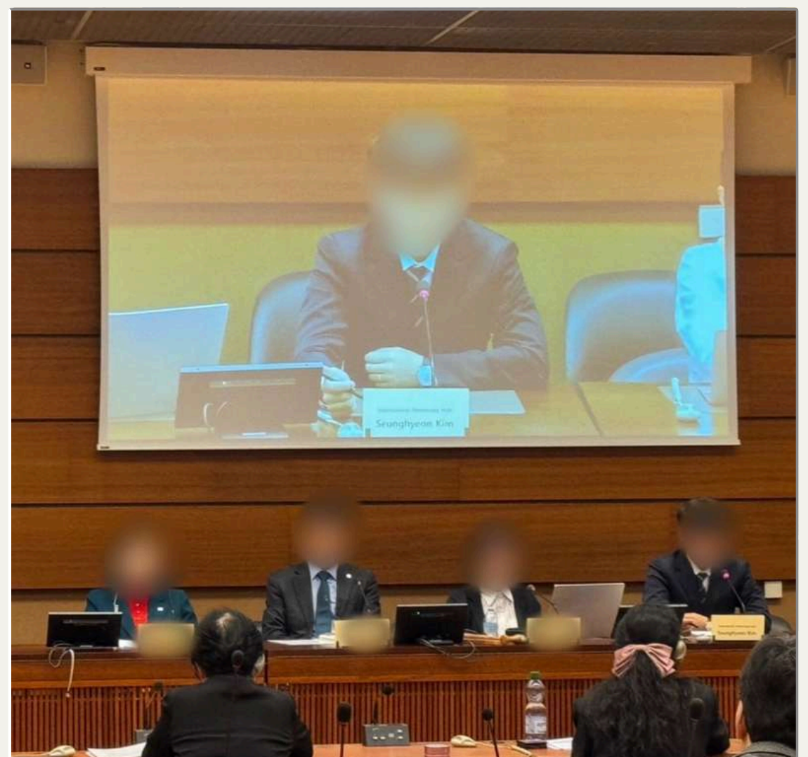
스위스 제네바 유엔 인권최고대표사무소