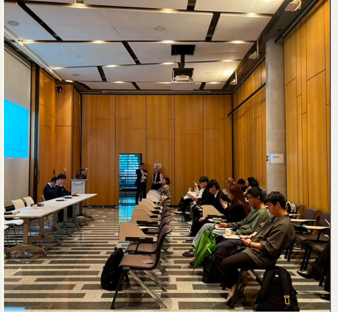
주한캐나다대사관 주제: 여성인권