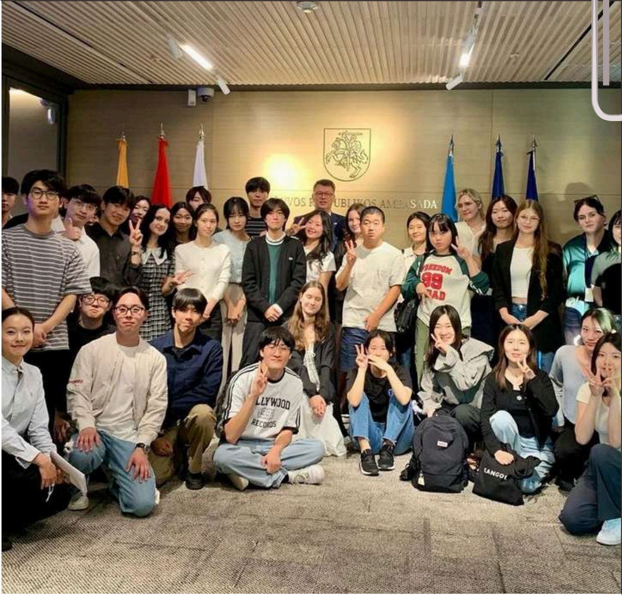
주한리투아니아대사관 주제: 강제노동